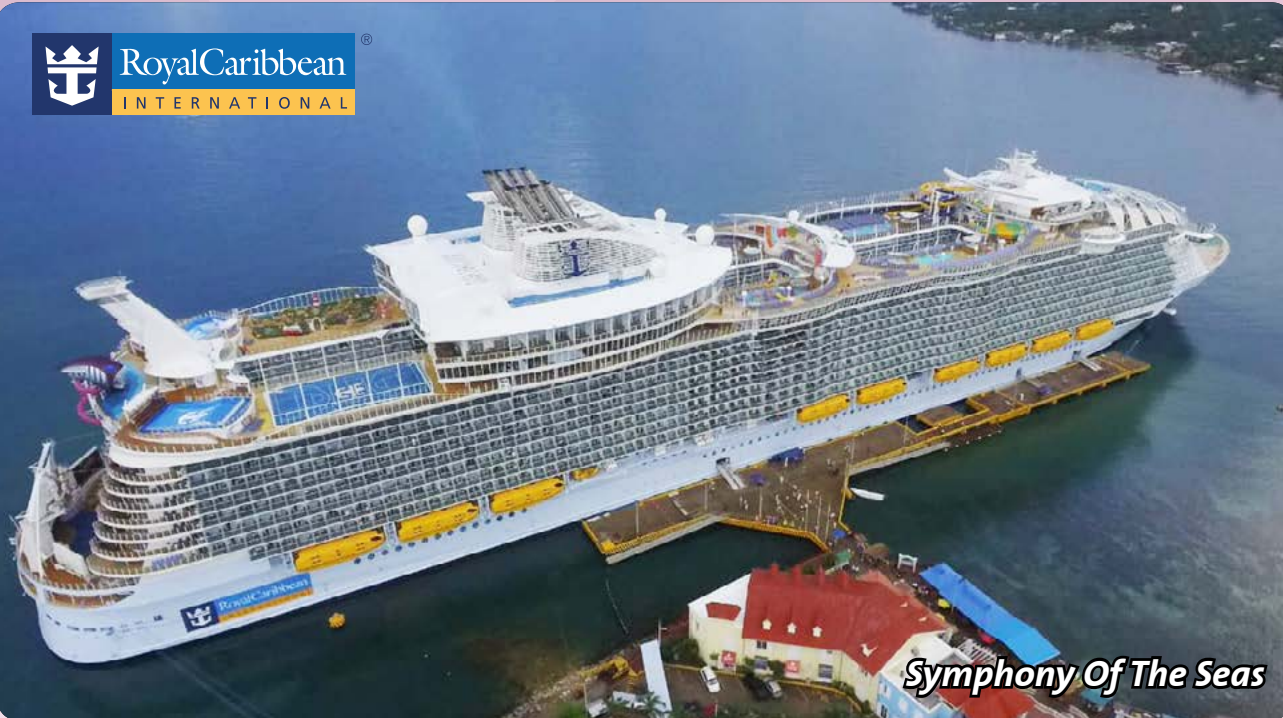
Symphony Of The Seas